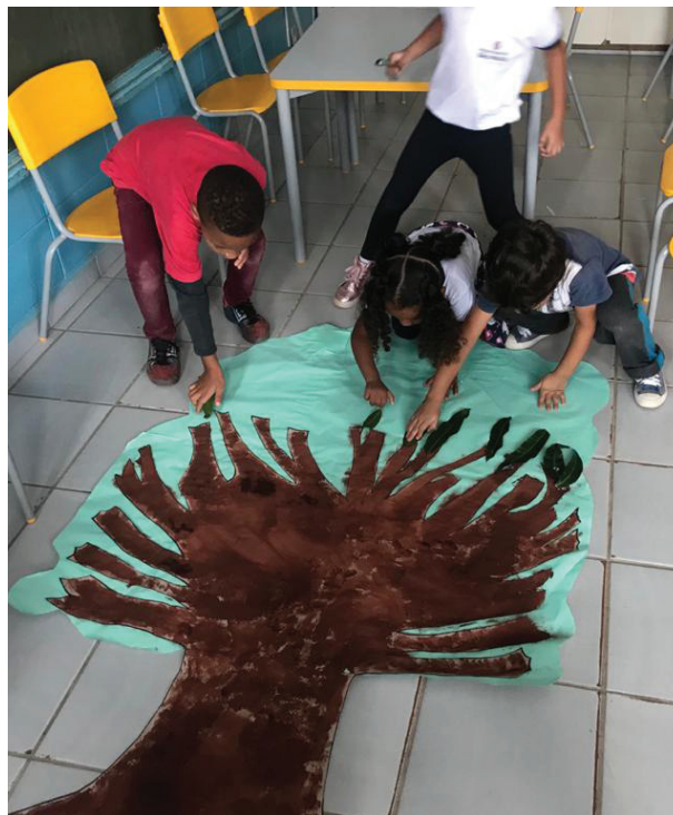
Crianças construindo pé de manga na EMEI Raul Nemenz (DRE Guaianazes). A professora coletou alguns galhos da árvore para compor a produção.