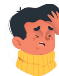
Dor de cabeça e cansaço