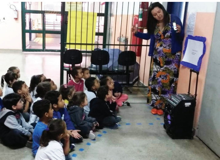
Coordenadora Pedagógica apresentando a versão audiovisual acessível de um poema no celular, com o som amplificado para as crianças escutarem a narração. EMEI CEU Cantos do Amanhecer (DRE Campo Limpo)

Reafirmando a potência da poesia de aflorar nosso imaginário, as respostas das crianças foram incrivelmente poéticas.