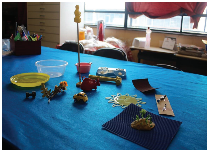
Objetos tridimensionais desenvolvidos e adquiridos para a atividade na EMEI Professor Raul Nemenz (DRE Guaianases).

Essas são apenas algumas sugestões. Você pode escolher, desenvolver e inventar outros objetos conforme a disponibilidade de materiais.