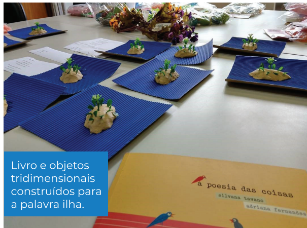
Livro e objetos tridimensionais construídos para a palavra ilha.

poemas?”. Acolhemos suas respostas e apresentamos o livro em questão.